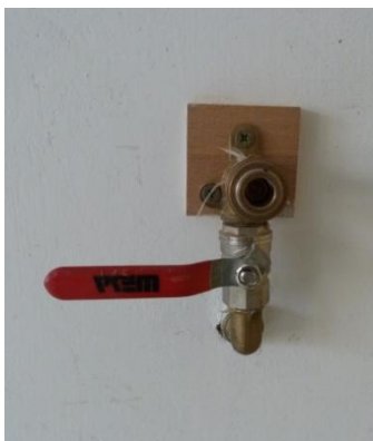
rychlospojka pro rozvod vzduchu